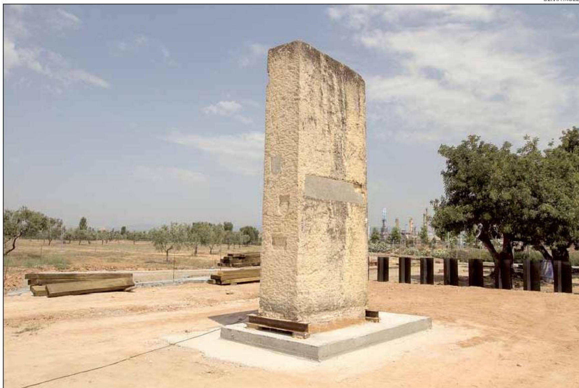
El Piló del Rescat a la seva nova ubicació, a tocar del Camí del Racó i molt a prop del Raval de la Mar.

Conta la llegenda que els Senyors de Pinós aplegaren dobles, brocat, vaques i cavalls, però faltaven les donzelles. Els Senyors de la Baronia acordaren, no sense recança, que les famílies que en tinguessin tres, en donarien dues, les que en tinguessin dues en donarien una, i entre les que